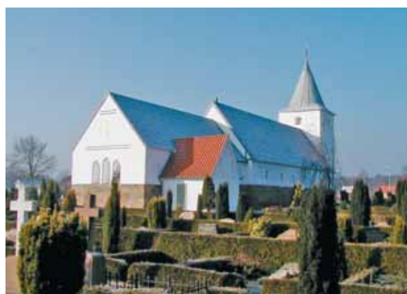
Aal Kirke set fra nordøst

Kirken ligger lidt syd for midten af kirkegården, som dog i nyere tid er blevet udvidet mod syd. Kirkegården er omkranset af en vold, som på ydersiden afsluttes som et stendige. Der er stort set ingen beplantning omkring kirkegården bortset fra et enkelt stort gammelt egetræ i det nordvestre hjørne. På kirkegården er der fra den lille grusbeflagte parkeringsplads mod nord en mindre allé af fint klippede træer ind mod kirken. På grund af den minimale beplantning markerer kirken sig flot fra hele dens nære område. Vest for den nordre del af kirkegården er der en hvidkalket og teglhængt bygning med toilet og materialeplads til graveren.