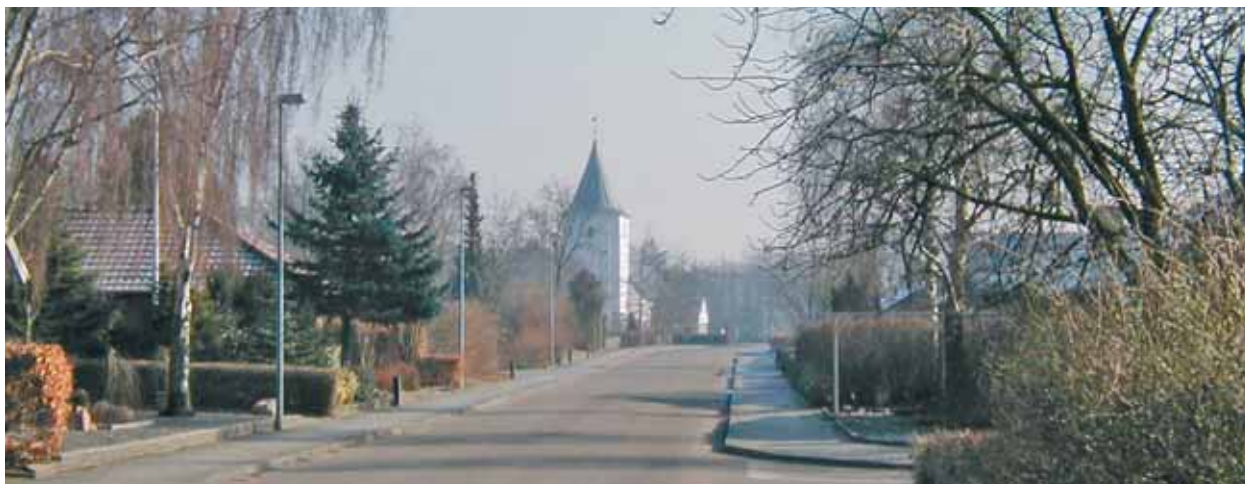
Aal Kirke set fra vest