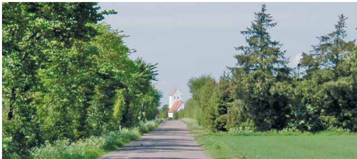
Agerbæk Kirke set fra øst