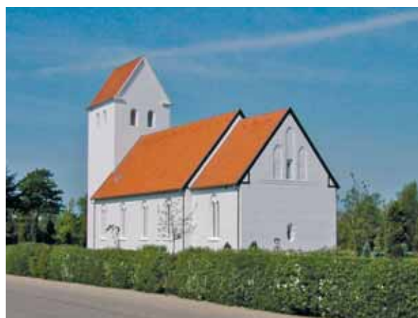
Agerbæk Kirke set fra sydøst

På grund af kirkens placering og bevoksningen nord for markerer kirken sig overhovedet ikke i forhold til størstedelen af byen. Kun fra den del af byen, der ligger langs vejen, Sønderbyen, mod