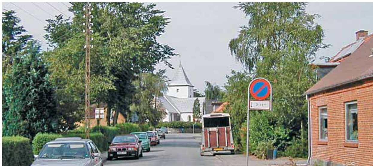
Ansager Kirke set fra øst/nordøst