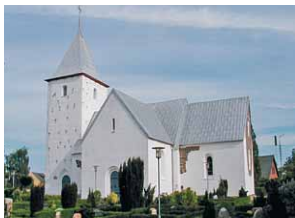
Ansager Kirke set fra syd/sydøst

Kirken ligger på en højning i forhold til den åbne plads midt i Ansager by. Den ligger nordligt på kirkegården, som mod nord og øst er afgrænset af et stendige. Mod nord er toppen af diget beplantet med hybenroser, mens det mod øst, ind mod kirkegården danner en vold. Her står der indenfor en række birketræer. Mod syd afgrænses kirkegården af en hæk. Ud mod den lille asfaltbelagte parkeringsplads vest for kirken optages terrænforskellen af en terrassedelt kampestensmur. Herfra fortsætter kirkegårdsgrænsen som et højt stendige, der mod syd ender som en vold. Mod syd og vest er der i forbindelse med kirkegårdsgrænsen et læhegn af blandede træer, som skærmer noget for kirken. Syd for kirken, ved østre kirkegårdsdige ligger to sammenbyggede, hvidkalkede bygnin-