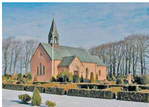
Bejsnap Kirke set fra sydvest

Kirken ligger på det åbne land mellem den spredte gårdbebyggelse. Den markerer sig flot fra syd, hvor der er frit udsyn til og fra kirken. Derimod skærmer læbeplantningen meget for kirken i de øvrige retninger, hvor det kun nogle steder er mu-