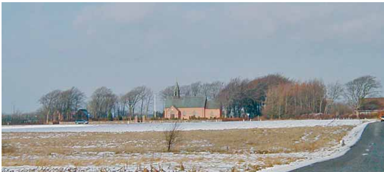
Bejsnap Kirke set fra syd