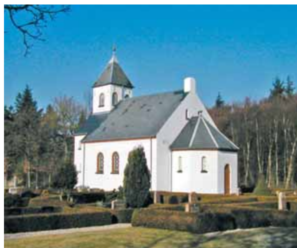
Børsmose Kirke set fra sydøst

Kirken ligger for sig selv i et område, der fungerer som militært øvelsesterræn. På grund af den tætte beplantning i større og mindre områder omkring kirken har den ingen fjernvirkning. Kirken ses først fra vejen, når man kommer helt tæt på. Syd for kirken er der uden for den nærmeste beplantning dog