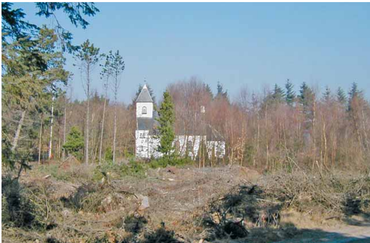
Børsmose Kirke set fra syd