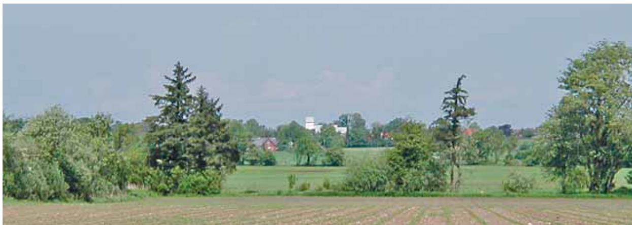
Fåborg Kirke set fra syd