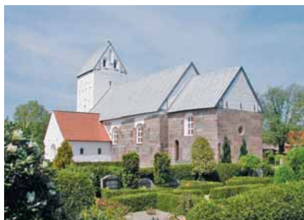
Fåborg Kirke set fra sydøst

I kirkegårdens sydøstlige hjørne er der et hvidkalket ligkapel med tegltag, der i materialerne falder