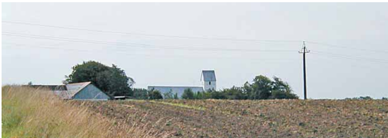
Hodde Kirke set fra nord