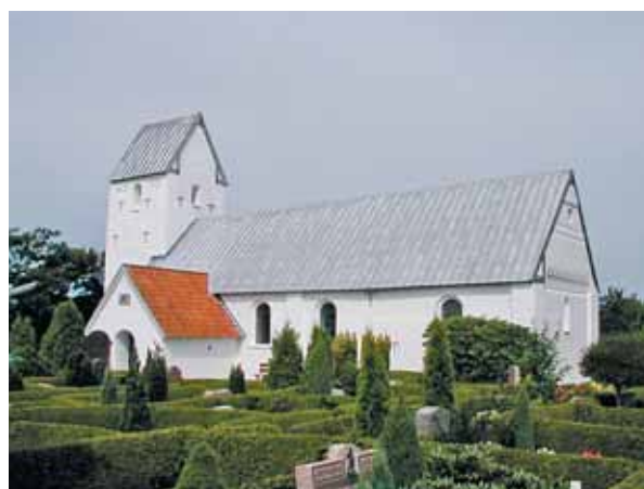
Hodde Kirke set fra sydøst

Kirken ligger omtrent midt på kirkegården, som er omkranset af et stendige, der på indersiden danner en vold. Mod vest er der et læhegn af mellemstore træer, men det er muligt at se toppen af tårnet over trækroneerne. I forbindelse med det søndre dige er der mød øst en gammel stråtækt skolebygning, som nu er museum. Skolen og kirken danner sammen et meget fint miljø, der absolut er bevaringsværdigt. Syd for kirkegården er der en grusbelagt parkeringsplads og langs indkørslen dertil fintklippede græsarealer med en lille have nord for. Det hele er meget velholdt. Syd for kirkegården er der mod vest et lille rødstens hus med tegltag til graveren. Husets arkitektur er middelmådig, men dets beskedne størrelse gør, at det ikke dominerer området. Vest for kirkegården mod syd er der en mindre redskabsbygning, som stort set ikke er synlig fra parkeringspladsen og kirkegården, når der er løv på træer og buske. Der er frit udsyn over de åbne marker mod nord samt åbent udsyn til Hodde by mod syd, hvilket understreger kirkens landlige beliggenhed.