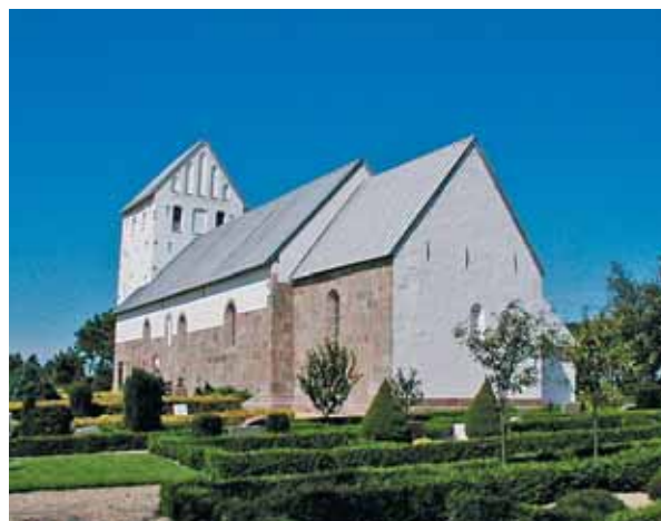
Janderup Kirke set fra sydøst

Kirken ligger i den sydlige del af kirkegården, som er omkranset af et stendige med græs på toppen. Mod vest er der en lav læbeplantning, hvorimod der mod syd er frit udsyn over de store åbne eng- og marskområder omkring Varde Å. Mod øst og nord er der mindre beplantning, som ikke skærmer væsentlig for den store kirke. Nord for kirkegårdens vestlige del ligger den grusbelagte parkeringsplads, hvorfra der udover til kirkegården er adgang til ligkapellet og den tidligere præstebolig, som nu benyttes af graveren. Kapellet ligger i læbeplantning vest for parkeringspladsen og er hvidkalket med tegltag. Den tidligere præstebolig er ligeledes hvidkalket med tegltag og ligger øst for parkeringspladsen og langs med kirkegården. Materialer og arkitektur på begge bygninger falder fint ind i kirkens omgivelser.