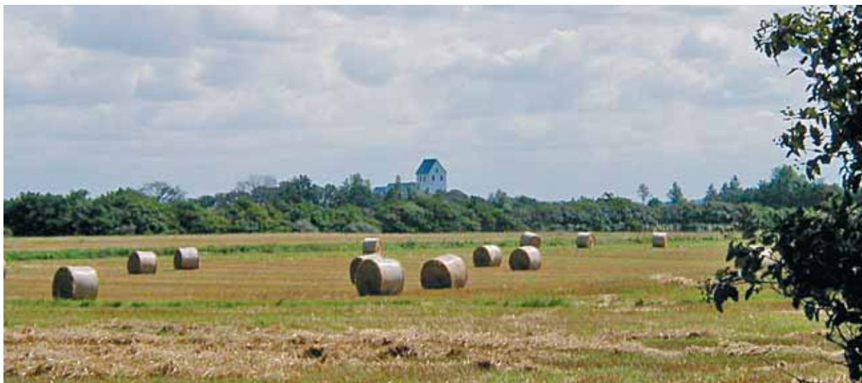
Janderup Kirke set fra nordvest