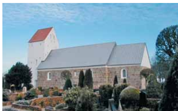
Kvong Kirke set fra sydøst

Kirken ligger omtrent midt på kirkegården, som er omkranset af et stendige. Mod øst er der en ca. 3 m høj hæk, og mod syd en hæk på knap 2 m. Der er et fint forhold mellem hækken og kirkegården, men desværre skærmer den noget for udsigten over det åbne land. Måske var det muligt at beskære hækken til en lidt lavere højde. Den meget velholdte kirkegårds beplantning er veltrimmet, de gamle træer, er kraftigt stynede, så de ikke dækker for indsigten til kirken. Nordøst for kirkegården er der to hvidkalkede, mindre bygninger med tegltag, som udgør henholdsvis ligkapel og materielhus til graveren. Bygningernes diskrete arkitektur og materialer samt deres lidt tilbagetrukne placering er i fin overensstemmelse med kirkens område. Nord for kirkegården er der en grusbelagt parkeringsplads, hvorfra der også er indkørsel til gården vest for kirken.