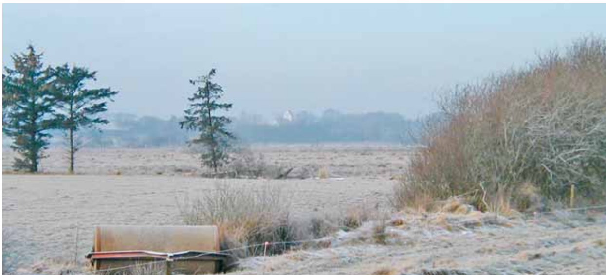
Kvong Kirke set fra øst