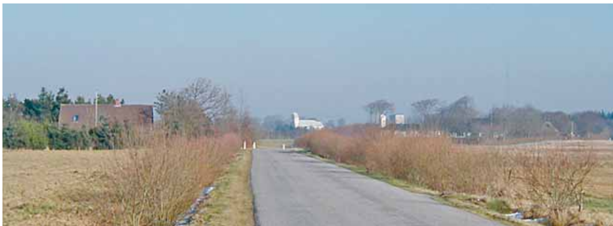
Lunde Kirke set fra sydvest