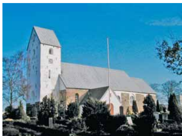
Lunde Kirke set fra sydvest

Kirken ligger i den nordvestlige del af byen og grænser op til det åbne land mod sydvest og nordvest, mens der direkte vest for kirken ligger en gård. Mod nord grænser kirkens område op til en sportsplads i forbindelse med skolen. Den megen åbenhed omkring kirken samt dens lidt høje placering styrker dens dominans i det nære miljø. Syd og sydøst for kirken er der bygget nogle nye ræk-