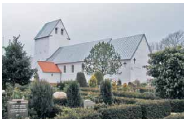
Lydum Kirke set fra sydøst

Kirken ligger i den østligste del af byen og grænser mod øst op til det åbne land. I forhold til byen ligger kirken på en lokal højning, hvilket styrker