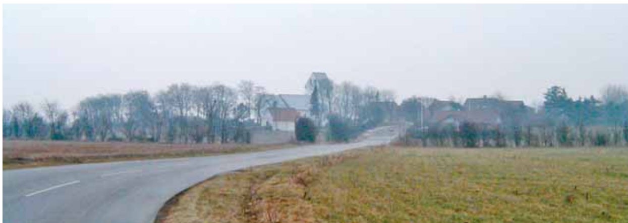
Lydum Kirke set fra nordøst