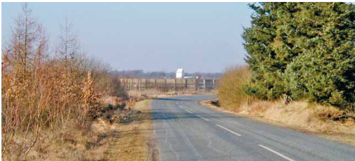
Nørre Nebel Kirke set fra syd/sydøst