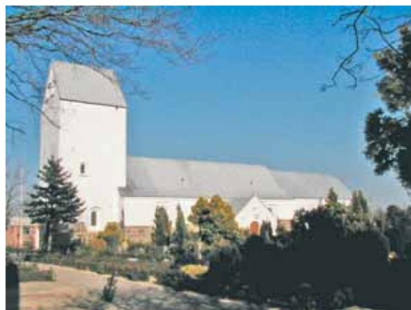
Nørre Nebel Kirke set fra syd/sydvest

Kirken ligger i den sydøstlige del af Nørre Nebel by. Den markerer sig dårligt i bybilledet og er kun