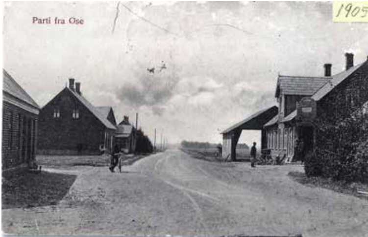
'Præriebyen' Nordenskov ca. 1905

Nordenskov havde i starten karakter af 'prærieby' langt ude på landet – en dansk analogi til det samtidige nybyggeri på de amerikanske prærier.