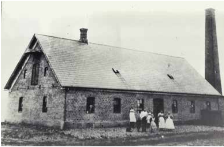
'Nordenskov Mejeri Anno 1885.

Indtil 1885 var Nordenskov blot et øde hedeområde, hvor to veje eller hjulspor krydsede hinanden. I 1885 blev bønderne i området enige om at bygge Øse Sogns Andelsmejeri ved krydset mellem de to veje, lokalt i mange år benævnt 'Korshjørnet'. Under etableringen blev mejeriet nævnt som Øse Sogns Andelsmejeri, men allerede efter at byggeriet var afsluttet, fik det navnet Nordenskov Andelsmejeri.