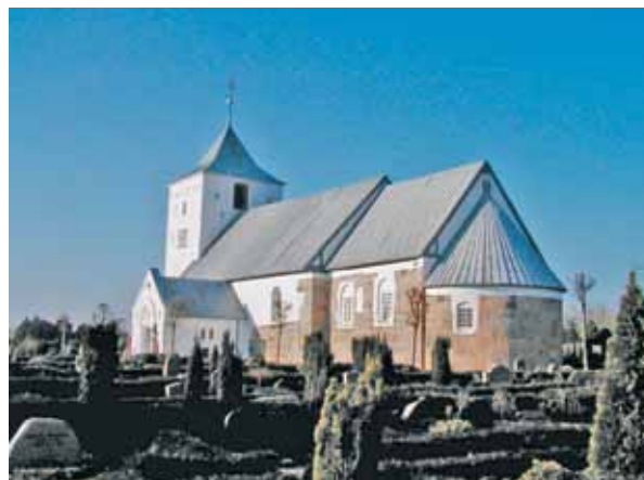
Outrup Kirke set fra sydøst