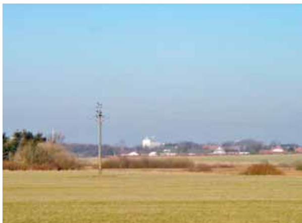
Outrup Kirke set fra syd/sydvest