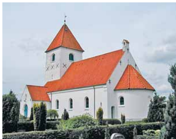
Skovlund Kirke set fra sydøst

Kirken ligger midt på kirkegården, som mod syd og øst er afgrænset af en hvidkalket teglstensmur. mod nord og vest er der hæk. Rundt om kirkegården er der træer af forskellig størrelse. De skærmer delvist for kirken, men uden at den er gemt væk. Man bør dog være opmærksom på, at træerne ikke med tiden lukker for meget af. Fra den SF-stensbelagte parkeringsplads, som ligger syd for kirken under kronerne fra nogle gamle egetræer, er der en allé op til kirkens indgang. Alléen skærmer noget for kirken, men udgør samtidig et fint indgangsparti. Østligt ved den søndre kirkegårdsmur ligger et hvidkalket ligkapel med tegltag. Parkeringspladsen, kapellet og kirkegårdsmuren danner en harmonisk helhed. Dog ser højbedet ud mod vejen i parkeringspladsens østende noget pjusket ud. På kirkegården er der en del større buske og mindre træer, der dog ikke konkurrerer med den store kirke. Uden for det nordvestre hjørne af kirkegården er der et skur til graverens materiel samt materialedepot. Den afsides placering hindrer, at dette skæmmer kirkegården for meget.