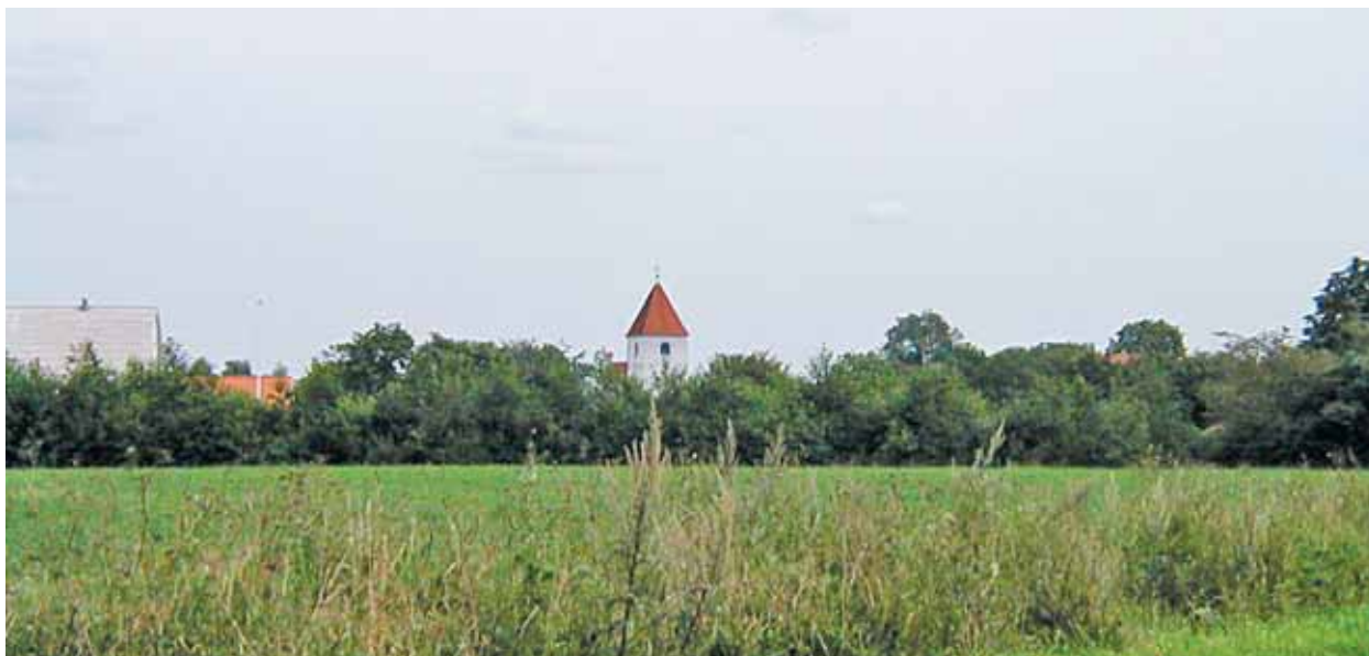
Skovlund Kirke set fra vest