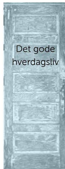
Det gode hverdagsliv