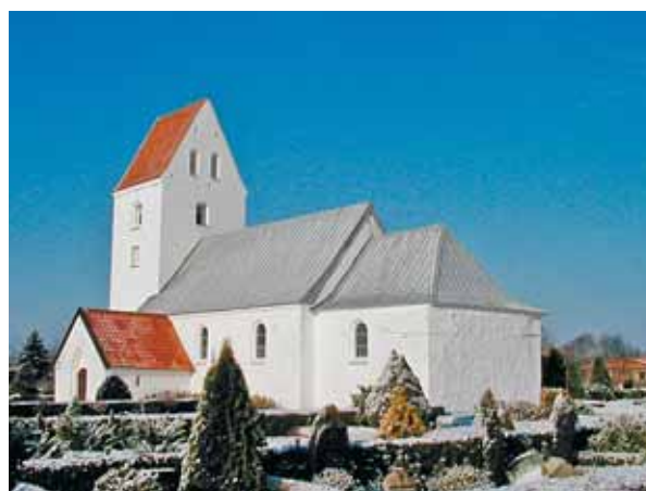
Strellev Kirke set fra sydøst

Kirken ligger syd for Lynevej i den vestlige del af den relativt lille landsby. I denne del af landsbyen ligger bebyggelsen på nordsiden af Lynevej. Kirkegården grænser op til det åbne land mod syd, og mod øst er der en mark mellem kirkegården