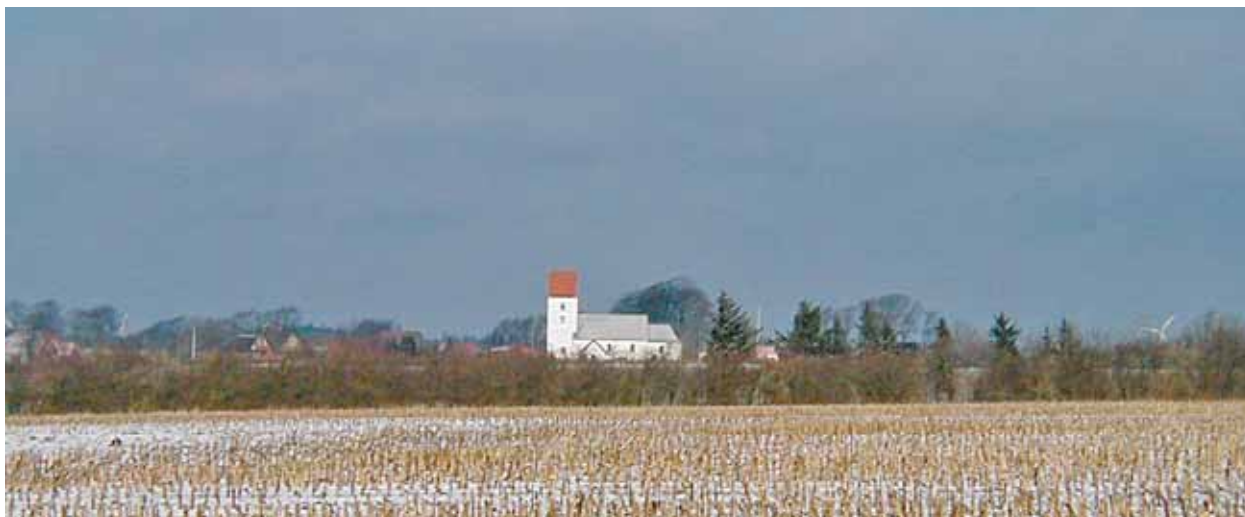
Strellev Kirke set fra syd