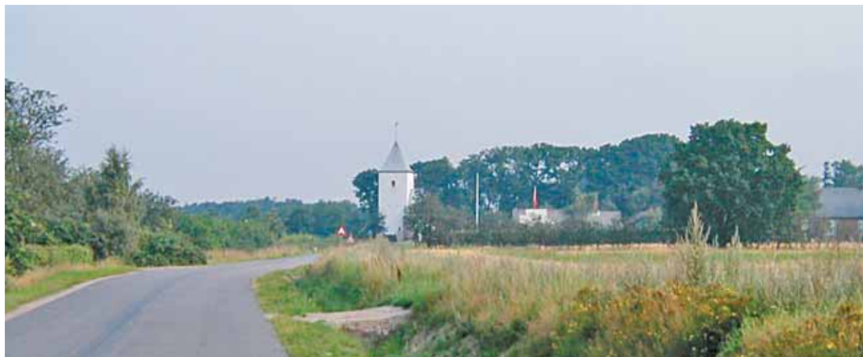
Thorstrup Kirke set fra syd