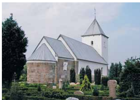
Thorstrup Kirke set fra nordøst

Kirken ligger midt på kirkegården, som er omkranset af et stendige, der indvendig er udformet som en græsbeklædt vold. Inden for diget mod vest samt den vestlige del mod syd, hvor diget i stedet for at danne vold optager terrænforskellen, er der en bøgehæk. På volden mod sydøst står der gamle store egetræer, som bør bevares på trods af, at de skærmer en del for kirken fra vejen. Træerne danner et fint miljø ved denne del af kirkegården, samt ved græsarealet foran. I den øvrige del af diget mod syd er der plantet nye egetræer, men her bør det undgås, at de bliver for store og skærmer for kirken. Ud for midten af diget mod syd er der en asfaltbelagt parkeringsplads, der går i ét med Gl. Præstevej syd om kirken. Arealet til kirkegårdsmateriel nord for kirkegården har i udseende ikke samme fine, høje standard som de øvrige arealer