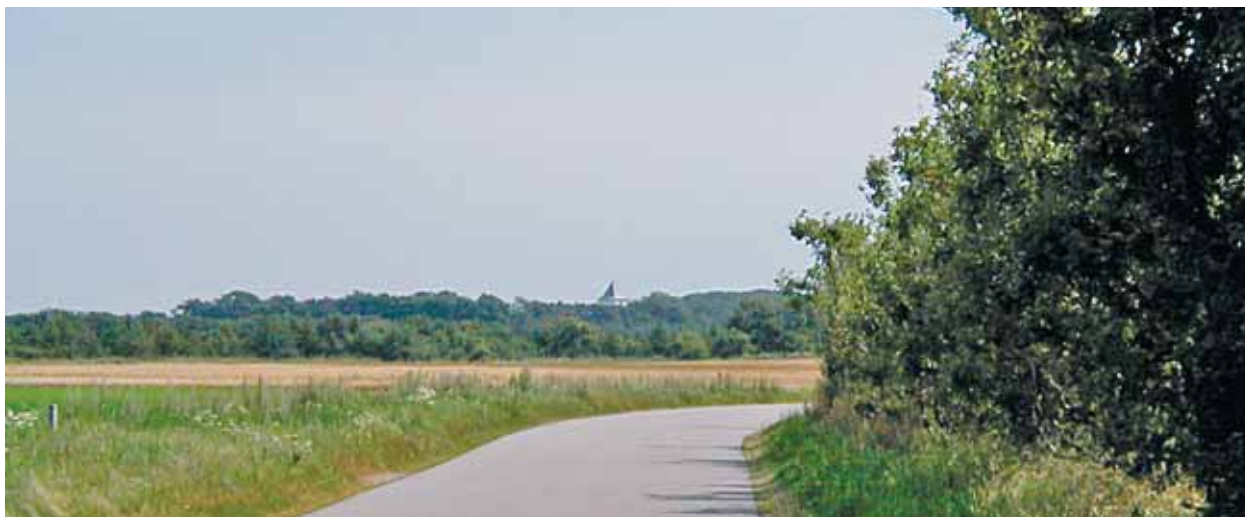
Tistrup Kirke set fra nordvest