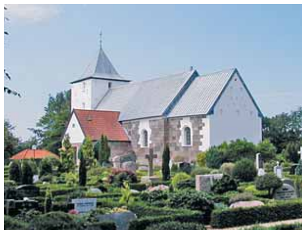
Tistrup Kirke set fra øst/sydøst

Kirken er placeret i den sydvestlige del af kirkegården, som ligger på en flad højning i landskabet. Kirkegården er omkranset af et stendige, der på indersiden er dannet som en vold og mod vest blot optager terrænforskellen. På grund af en læbeplantning på indersiden af diget mod vest, nord og øst er kirken næsten helt skjult i disse retninger. Mod syd er der en række opstammede birketræer, der lader kirken delvis synlig. Dog burde der nok her tyndes ud, så kirken kunne markere sig bedre i omgivelserne mod syd, som ellers danner et fint miljø med den gamle kro på den anden side af Tistrup Kirkevej syd for kirken. Delvist skjult i læbeplantningen mod vest er der et hvidkalket hus med tegltag til graveren, og midt på den østlige del af kirkegården er der et ligeledes hvidkalket ligkapel med tegltag. Disse bygninger passer både i materialevalg og udformning godt ind i kirkens omgivelser. Syd for kirkegården er der et trekantet areal udlagt som en grusbeltet parkeringsplads.