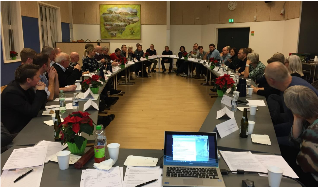
Billede fra den inspirerende konference om skoler og dagtilbud i Helle Hallen den 15. december.

Bemærk, at vi i dette høringssvar kun forholder os til landdistrikterne og ikke Varde bys skoler og dagtilbud.