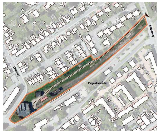
Projektområdet omkring remisen.

Projektet tager udgangspunkt i de eksisterende arealer og bygninger omkring remisen ved Vestbanens stationsområde. Projektet søger at omdanne området til et aktivt by- og boligområde med nye attraktive boliger på kanten af Varde indre by og villabyen mod nord. De eksisterende bygninger og anlæg er sammen med de landskabelige kvaliteter projektets rammer og skaber områdets identitet.