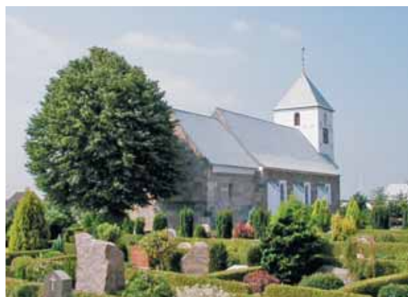
Horne Kirke set fra nordøst

Kirken ligger i den vestlige del af byen og er omgivet af bebyggelse på alle sider; de fleste steder dog på den anden side af en vej. Derved dannes der et stort åbent område omkring kirken, som styrker dens markering i nærområdet. De fleste af husene