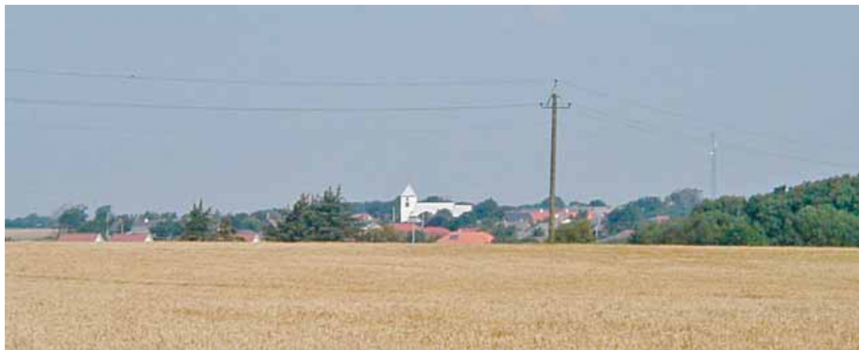
Horne Kirke set fra syd