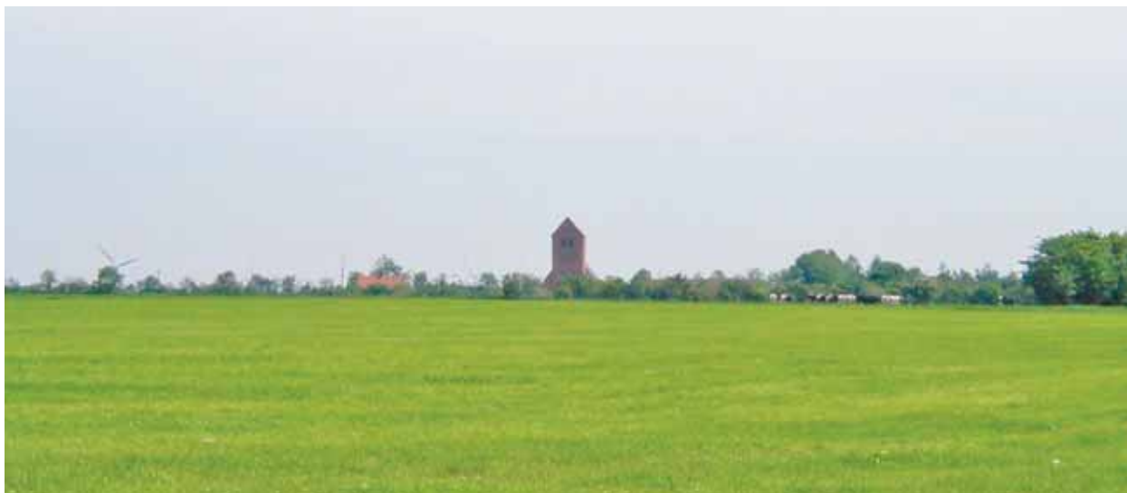
Rovsthøje Kirke set fra vest