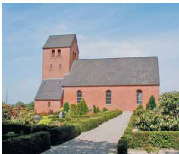
Rovsthøje Kirke set fra syd

Kirkens nærmeste omgivelser består af ældre og nyere villaer. Det forholdsvise store område omkring den store kirke samt dens høje placering gør, at den lavere bebyggelse på ingen måde dominerer over kirken. På trods af dens høje placering er