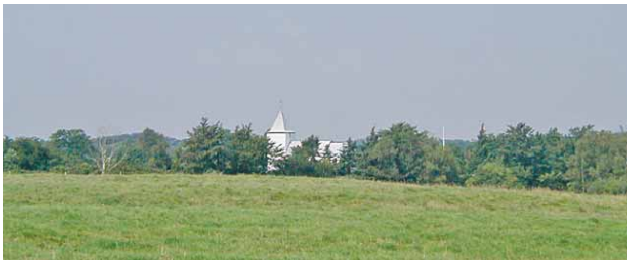
Billund Kirke set fra syd/sydvest