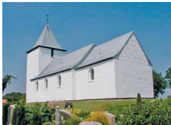
Billund Kirke set fra nord/nordvest

Kirken og kirkegården er placeret på en markant, lokal højning i dalområdet omkring Holme Å. I forhold til kirkegården ligger kirken yderligere hævet på en græsbeklædt høj. Den lokale højning er i siderne holdt sammen med et stendige, hvor indenfor kirkegården er omkranset af en bøgehæk. En allé nord for kirkegården fører ned til en nyere kirkegård vest for kirken. Ad denne allé kommer man også til en grusbelagt og velholdt parkeringsplads vest for den gamle kirkegård. Sydligt på denne parkeringsplads er der et hvidkalket hus med tegltag til graveren. I materialer samt med dens lave placering i forhold til kirken falder den fint ind i området. Nordøst for kirken, uden for kirkegården er der et hvidkalket ligkapel med tegltag. Kuppet falder også fint ind i omgivelserne. Øst for kirken, på den anden side af vejen, Smedebakken, er der en asfaltbelagt parkeringsplads, som ikke lever op til det ellers meget fine miljø, der er omkring kirken og den høje standard, det er holdt i.