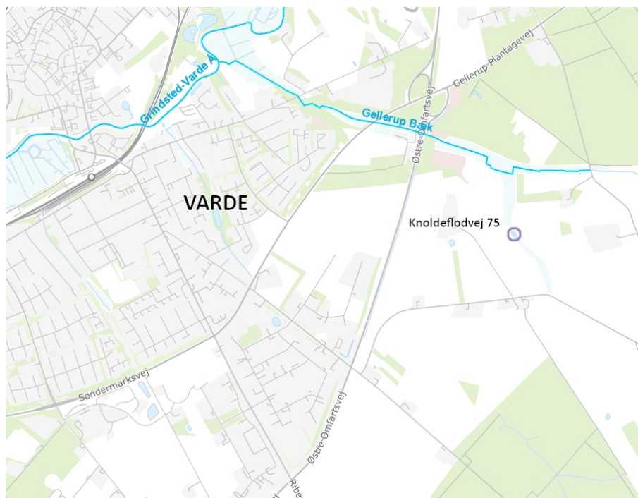
Figur 1 Kortudsnit placering af søen sydøst for Varde By.

På vedlagte kortbilag er der vist, hvilke tiltag vi har udarbejdet ved fælles møde den 31. august 2021, som der kan dispenseres til, og som du bekræftede du søger om. Du har derudover frafaldet din ansøgning om etablering af en sø i mosen nord for søen.