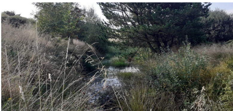
Figur 2 Sø med vandflade i midten, stejle brinker til venstre flades ud. Øen til højre ønskes fjernet.