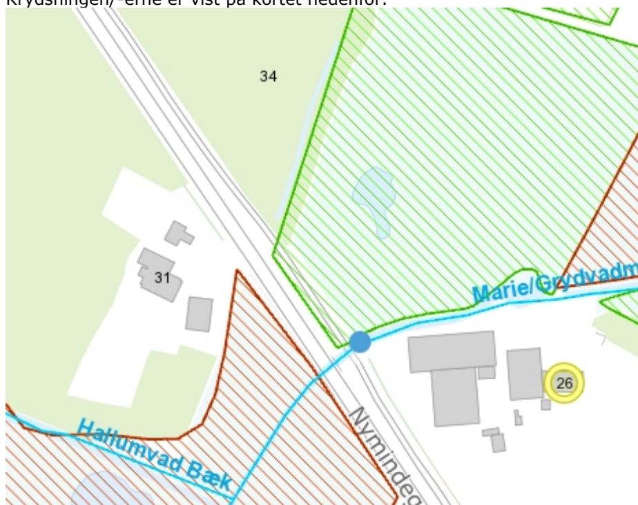
Fig. 1 Vandløbet passeres på ydersiden af cykelstien. Gennem §3-beskyttet område.

Krydsningen/-erne er vist på kortet nedenfor.