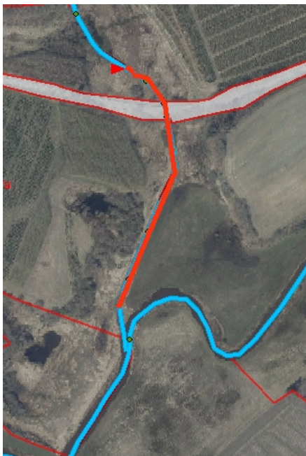
Oversigtskort 3: Rødt område markerer den konkrete strækning i Kybæk. Ingen §3-beskyttede områder.