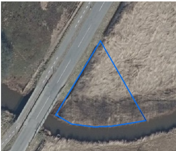
Fig. 1 Polygonen viser areal på ca. 550 m 2 ved Alslev Å med efterladt slam.

Slammet vil medvirke til at gøre rørsumpen endnu mere kulturpåvirket, hvilket er en naturmæssig forringelse. Der stilles derfor villkår om, at der skal foretages en afskrabning af slammet ned til oprindeligt terræn og en efterfølgende fjernelse af det afskrabede materiale. Afskrabningen skal foretages snarest.