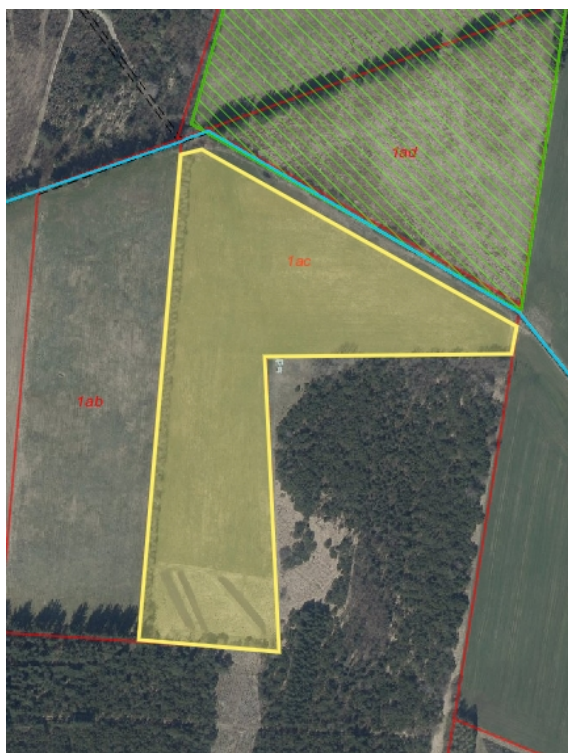
Luftfoto 2022, 1ac Ansager By

Hele matriklen er udlagt som negativt skovrejsningsområde pga. udpegning som øvrigt lavbundsområde. Nedenstående kortudsnit viser et vandløb, der ligger i den nordlige matrikelskel (Grønrose Øst) og en § 3 naturbeskyttet eng. Der skal holdes 20 m planteafstand til begge dele. Et lavbundsprojekt kan ikke forenes med skovrejsning, da træerne kan forhindre at der kan opnås en genopretning af en høj vandstand. Der anbefales træarter der kan tåle at stå vanddækket/forsumpet som elletræer eller gråpil i den nordlige del af projektområdet. Der kan meddeles tilladelse til skovrejsning i det område, der er gul markeret.