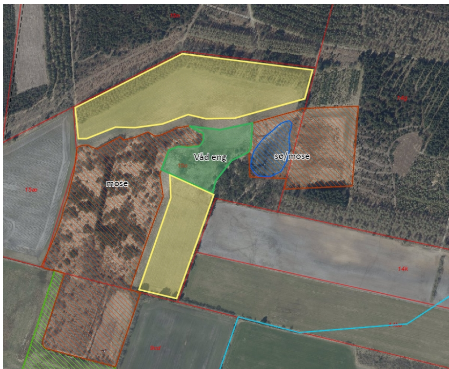
Luftfoto 2022, 15o Ansager By

Det vurderes, at hele matriklen kan udlægges til fredskov med opretholdelse af de § 3 naturbeskyttede arealer som lysåbne arealer. Der skal holdes en 20 m planteafstand til de beskyttede områder af hensyn til skyggeeffekt og drænvirkning ved beplantning/skovrejsning. Derudover vurderes det, at der med fordel kan udlægges et område mellem de to beskyttede arealer til en våd eng uden beplantning, lysåben (med grøn markeret), da det i forvejen på luftfoto ligner en våd lavning. Derved kan der skabes et bindeled mellem to naturområder med en større variation af naturtyper. På de med gul markerede arealer kan der tillades skovrejsning.