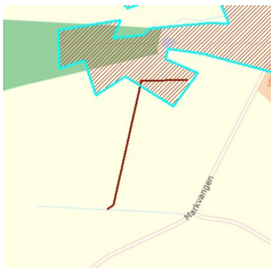
Fig. 3 Rød linje markerer ønsket grøft. Skravering markeret okkerpotentielt område.