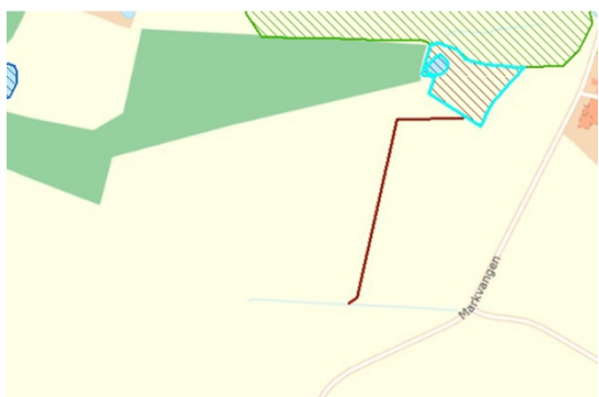
Fig. 2 Rød linje markerer ønsket grøft. Skravering markerer naturbeskyttet område.

Selve den rørlagte strækning ligger ikke i naturbeskyttet område. Varde Kommune vurderer, at der ikke bliver problemer i forhold til loven, når det ansøgte projekt bliver udført.