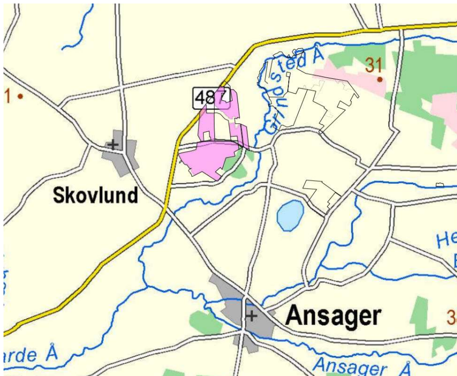
Oversigtskort, ansøgt område med lyserød, materiale fra ansøger

Du har på vegne af Kirkbi Invest A/S anmeldt skovrejsning på ca. 128 ha på matr.nr. 1v, 2a1, 2an, 2h, 3i, 4a, 7t, 22, 23, 24 Ålling By, Skovlund på et areal der i kommuneplanen er udpeget til et område, hvor skovrejsning både er ønsket og uønsket. 113,4 ha af det ansøgte ligger indenfor positivt skovrejsningsområde. Nærværende afgørelse omhandler kun arealerne indenfor positivt skovrejsningsområde. Resterende arealer indenfor negativt skovrejsningsområde behandles i en særskilt afgørelse.