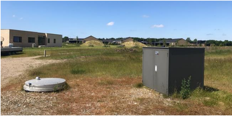
Figur 2 Foto af nyligt etableret pumpestation med kombineret el- og ventilskab, som forventes anvendt i det beskrevne projekt.

Slutteligt nedlægges renseanlæggene på de tre lokaliteter. Agerbæk snarest mulig efter myndighedsgodkendelse, Nordenskov i 2024 og i Sig i 2025. Nedlæggelsen omfatter nedrivning af eksisterende bygninger og bygværker.