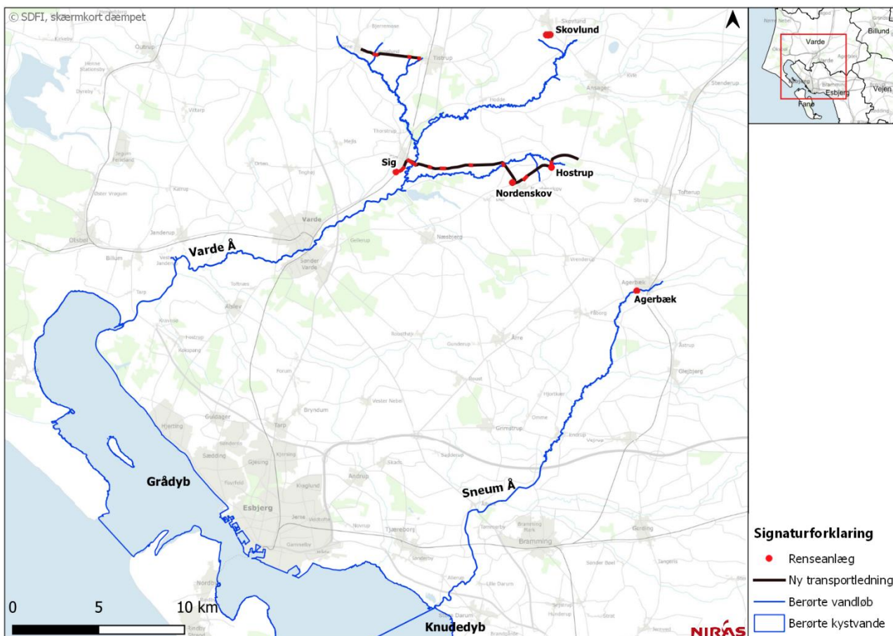
Figur 3 Figur med eksisterende renseanlæg, ny transportledninger samt berørte vandløb og kystvande.

I anlægsfasen vil anlæg af transportledninger kunne medføre en påvirkning på de vandløb, som ledningerne krydser. For at minimere påvirkningen vil krydsninger af alle vandløb ske ved styret underboring. Ved de styrede underboringer sikres at der er en god afstand til vandløbsbunden, så risikoen for såkaldte 'blowout', hvor boremudder trykkes op igennem vandløbsbunden og ud i vandfasen, er reduceret til et minimum. Ved de styrede underboringer, bliver der tilføjet kemiske stoffer (additiver) til det finkornede boremudder som bruges i processen. For at sikre at der ikke ske en kemisk forurening, som kan udgøre en risiko for vandmiljøet, benyttes der kun stoffer som miljømyndighederne har godkendt til formålet. Risikoen for blowout er generelt meget lille, og ved uheld vurderes påvirkningen at være lille i de berørte vandløb.