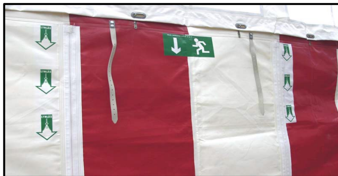
Figur 2.1 Mærkning af udgang og lynlås.

Udgange, der ikke anvendes i den normale drift af teltet, vil typisk være lukket med lynlås. Dette kan accepteres, såfremt lynlåsen er funktionsduelig og letløbende, og at der ved udgangen findes en afmærkning, der viser, hvor lynlåsen er placeret, og i hvilken retning den løber f.eks. som vist på Figur 2.1.