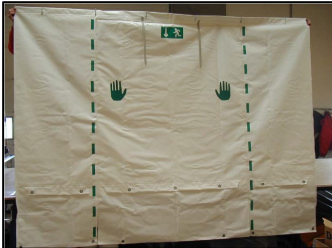
Figur 2.2 Udgang med velcrobånd.

Endelig kan der også anvendes gående døre. Kravet til dørene er de samme som til de øvrige udgange, og det skal derudover sikres, at dørene åbner i flugtvejsretningen, hvis forsamlings-teltet anvendes af flere end 150 personer.