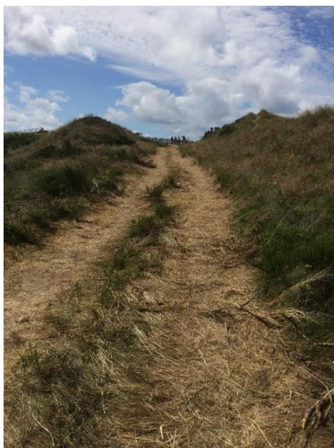
Private fotos af trampestien 09.07. 2017