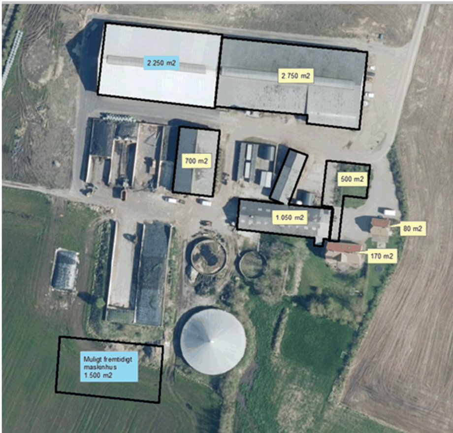
Fig. 1 Oversigt over tagarealer

Drænledningen forløber gennem matriklerne 1a, 2a og 5a, Bejsnap Gde., Ølgod. (Fig. 2)