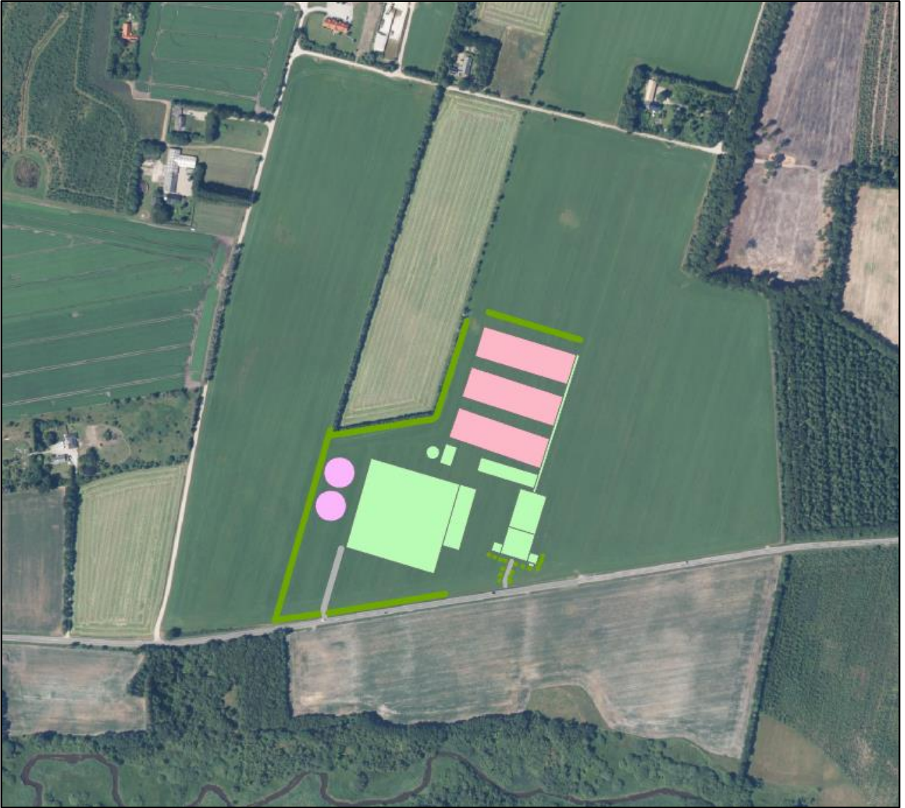
Bred grøn linje: Afskærmende beplantning.