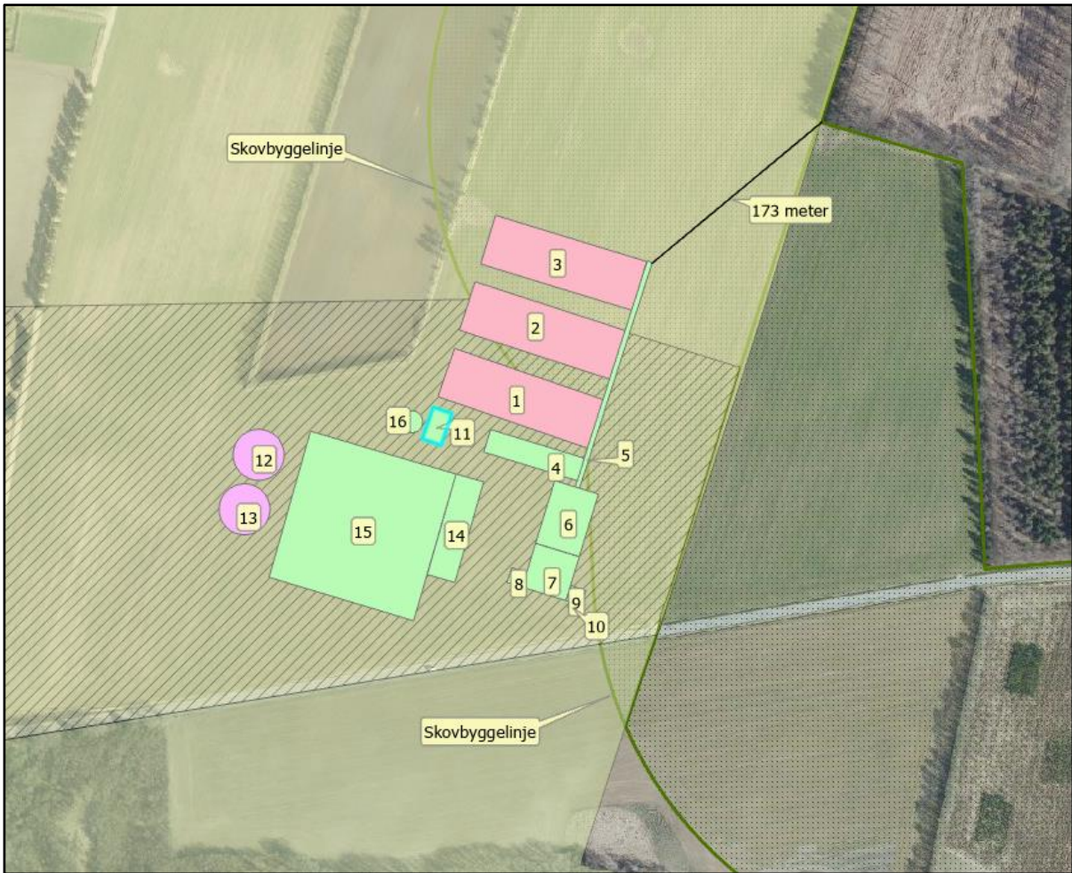
Situationsplan med angivelse af de enkelte bygninger/anlæg og angivelse af skovbyggelinje og landskabsforhold. Skravering: Overgangslandskab. Grønprikket flade afgrænset med grøn linje: Skovbyggelinje.